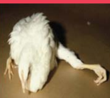
Incapacité de marcher