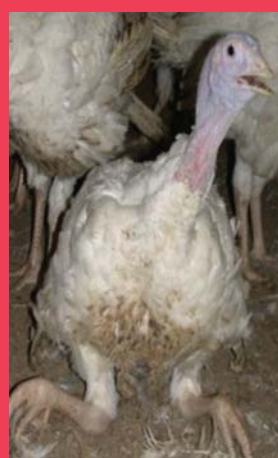
Incapacité de se lever ou de marcher en raison d'une anomalie physique (et non de la fatigue)